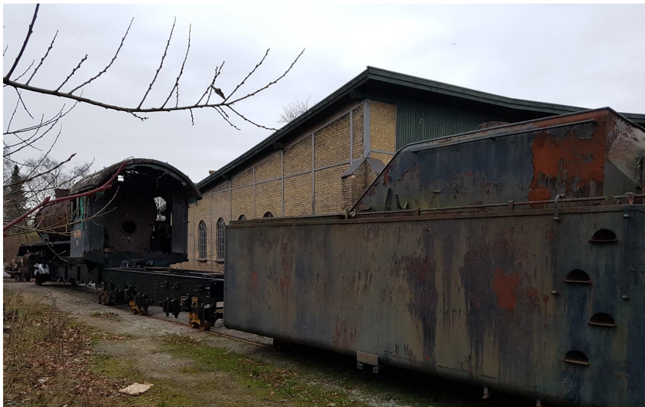
DSB H 783 som den står 11. december 2017 i Roskilde. JD

Når H783 er færdigrestaureret er det tanken, at det skal køre på Gedserbanen, da denne bane som gammel hovedbane er stærk nok til at bære lokomotiver, der i tjenestevægt vejer ca. 130 tons.